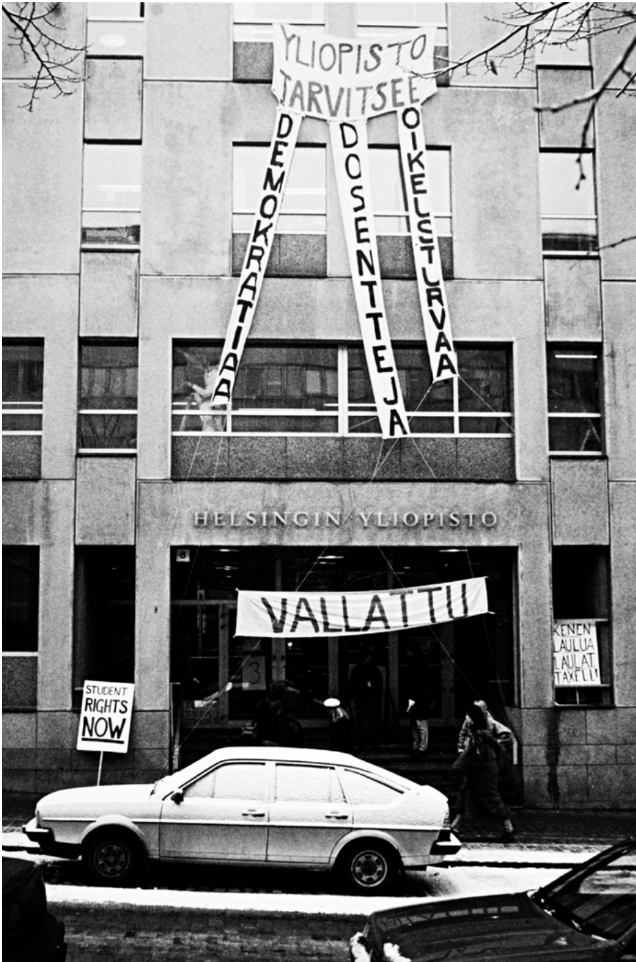
Helmikuussa 1990 opiskelijat valtasivat Helsingin yliopiston hallintorakennuksen, johon ripustettiin "Yliopisto tarvitsee demokratiaa, dosentteja, oikeusturvaa" -banderolli.