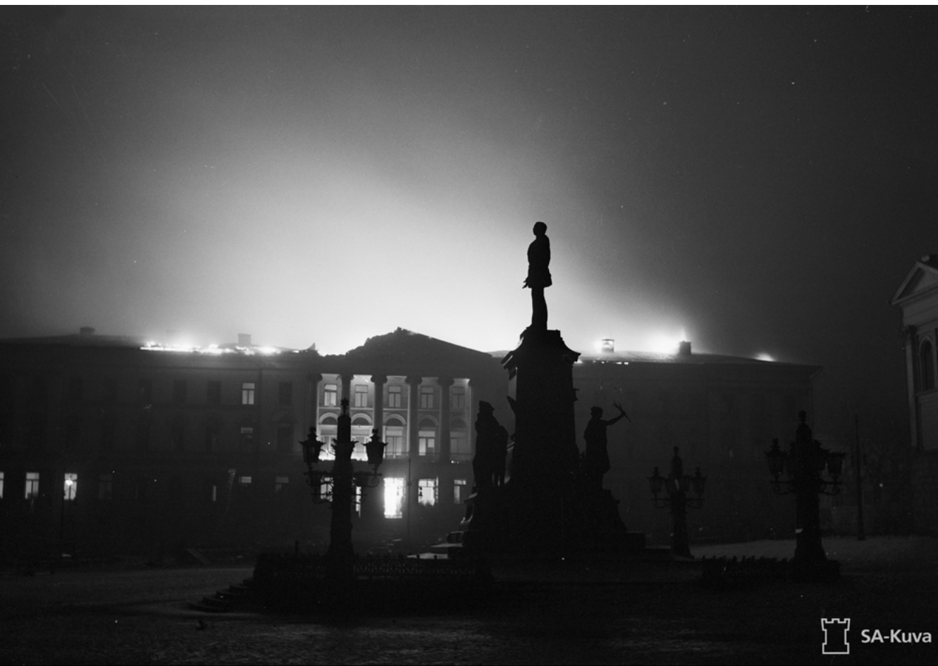
Yliopiston päärakennus Helsingin suurpommitusten jälkeisessä palossa 27. helmikuuta 1944.