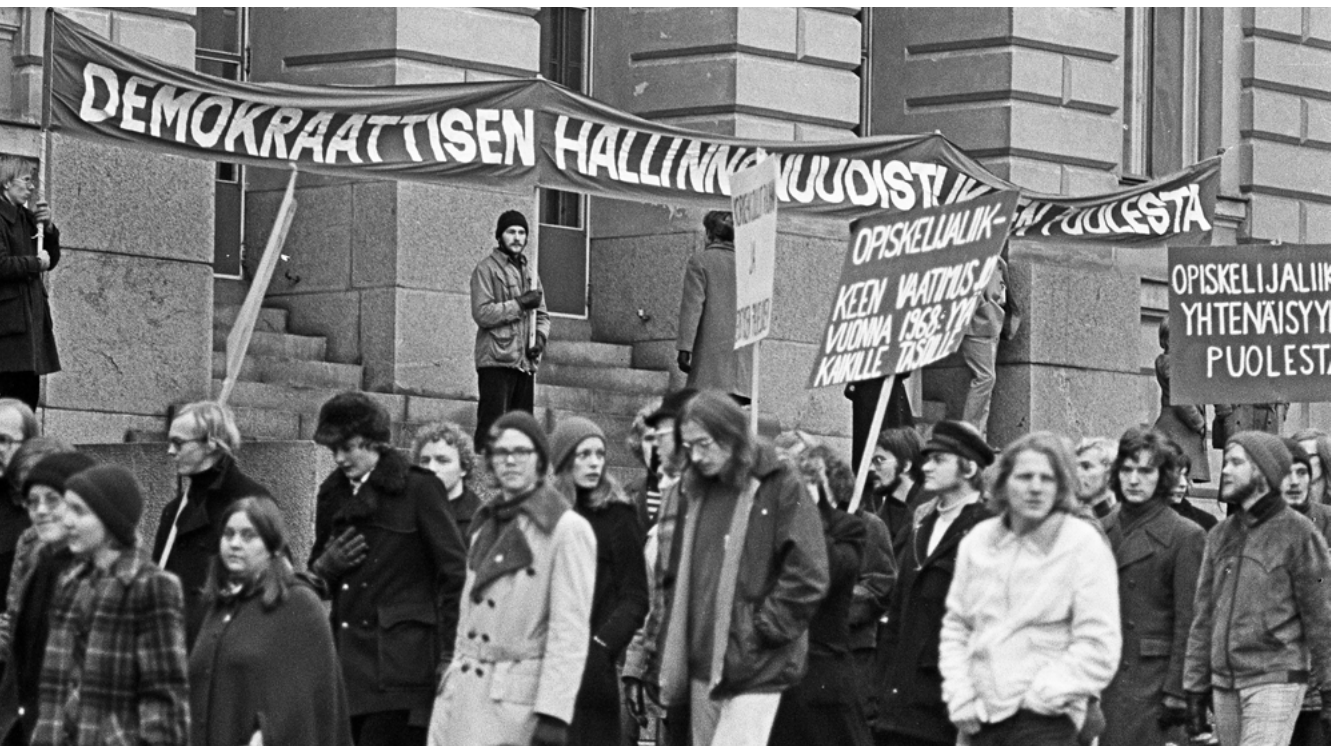
Opiskelijat osoittamassa mieltään Helsingin yliopiston päärakennuksen ulkopuolella marraskuussa 1972 yhtäläisen äänioikeuden puolesta.

Lex Sundqvist vedettiin käsittelystä vuonna 1973. Ylioppilaiden äänekkäissä mielenosoituksissa vaadittiin edelleen mies ja ääni -periaatetta, ja eduskunnan enemmistön tässä vaiheessa puoltamaa kolmikantaperiaatetta, jota sovellettaisiin hallinnon ylemmilläkin tahoilla, pidettiin taantumuksellisenä. Vähitellen keskitetty yliopistojen hallintouudistuspyrkimys hiipui valtiovallan intresseistä. Kalevi Sorsan ensimmäisen hallituksen ohjelmassa syyskuulta 1972 hallintouudistukseen viitattiin enää ympäröiväin viittauksin. 173