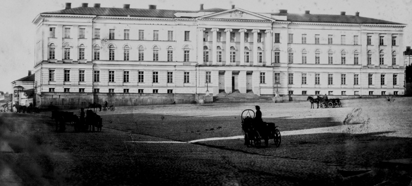
Carl Ludvig Engelin 1832 piirtämä Keisarillisen Aleksanterin-Yliopiston päärakennus nähtynä Senaatintorilta 1860-luvulla.

Kun yliopiston säädöksiä seuraavan kerran päivitettiin vuonna 1852, luotiin yliopiston dosenteille stipendijärjestelmä, jotta dosentit voisivat apurahan turvin perehtyä alansa tutkimukseen ja itsekin suorittaa tutkimustyötä. Tällä haluttiin ennen kaikkea taata dosenttiopetuksen korkea tieteellinen taso. 14 Stipendin saavat dosentit veloitettiin luennoimaan vähintään kahdesti viikossa. Samalla uudet määräykset laajensivat dosenttien toimenkuvan pelkistä yliopiston opettajista itsenäistä tieteellistä työtä harjoittaviksi tutkijoiksi. Koska dosenttien lukumäärä tähän aikaan oli alhainen ja moni dosentti samanaikaisesti toimi muissa yliopiston viroissa, riittivät aluksi perustetut kymmenen dosenttistipendiä turvaamaan koko dosenttikunnan toimeentulon. Stipendien määrä korotettiin vuonna 1871 vielä kahteentoista. 15