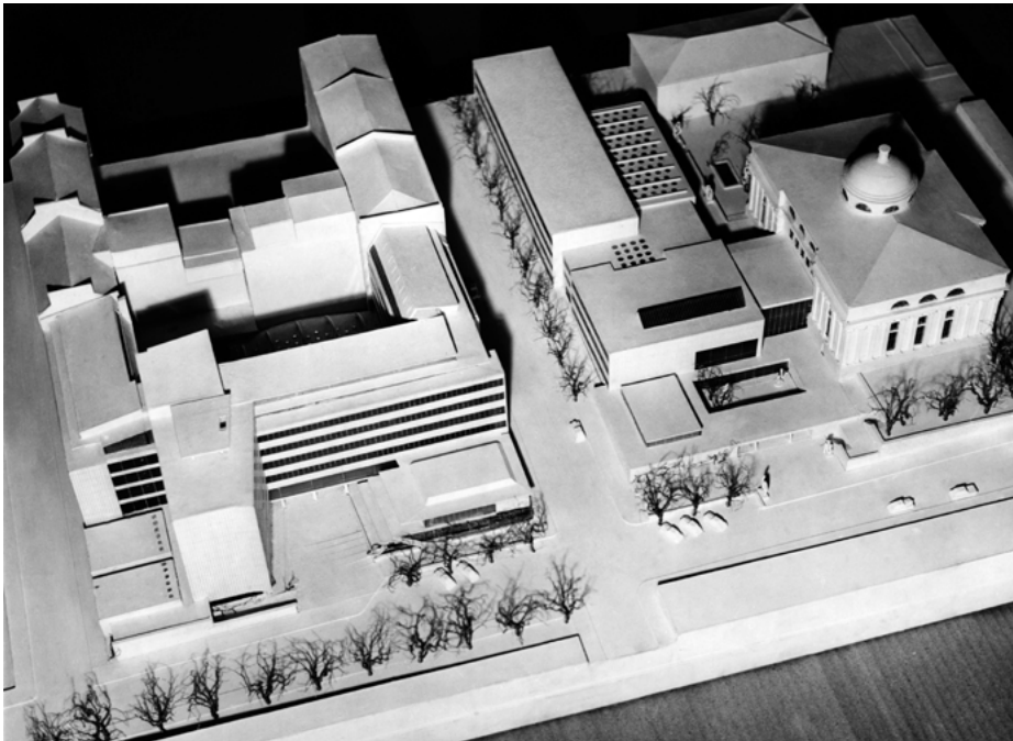
Aarne Ervin suunnitteleman Helsingin yliopiston uuden "instituuttirakennuksen" pienoismalli 1950-luvulta. Rakennuksen nimeksi valikoitui valmistuttuaan Porthania professori Henrik Gabriel Porthanin mukaan.

Dosenttien palkkauskomitean esittämiä uudistuksia dosenttijärjestelmään ei koskaan toteutettu ja esitys instruktoreinviroistakin unohtui jonkin ajan päästä. Opettajapula ja huoli opiskelijamäärästä laantui 1950-luvun puolivälissä ja yliopiston johdossa ajateltiin, että suurimmat opiskelijamäärät oli jo saavutettu eikä yliopisto enää merkittävästi kasvaisi. Asiaa kuvaa hyvin konsistorin mietintö vuodelta 1955, jossa arvellaan seuraavana vuonna valmistuvan Porthanianrakennuksen riittävän kodiksi vielä vuosikymmeniksi niin historiallis-kielitteelliselle osastolle, teologiselle, lainopilliselle ja valtiotieteelliselle tiedekunnille, kuin maantieteen, matematiikan ja meteorologian laitoksillekin. 95